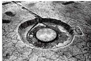
上野原遺跡(霧島市)1号探照灯跡【太平洋戦争】