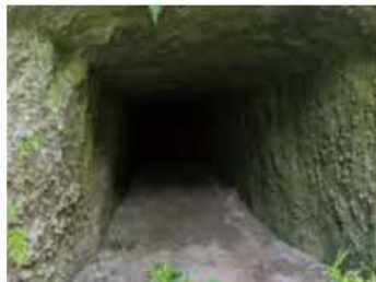
大窪地区(霧島市)の戦車場【太平洋戦争】

今年には太平洋戦争終結80年にあたります。県内でも戦争関連遺跡の発掘調査が行われてきて、様々な戦跡や遺構・遺物が発見されています。今回の企画展は、太平洋戦争や西南戦争などの戦跡を中心に展示を行い、併せて弥生時代・古墳時代の武具系の遺物などの発掘調査成果も展示します。各時代の“たたかい”について、紹介します。