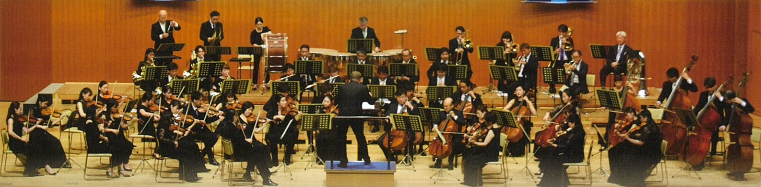
キリンマ祝祭管弦楽団