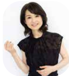
[特別ゲスト] 辛島 美登里

入場料金 [全席自由(税込)] 一般 1,000円 3歳~学生 500円 ※0歳児から入場できます。