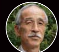
大木 公彦氏 鹿児島大学名誉教授

【場 所】霧島市国分シビックセンター 多目的ホール 【定 員】300人程度(要事前申込み) 【参加料】資料代100円