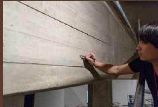
(Life-size Drawing (process))Hayward Gallery,London,UK 2012