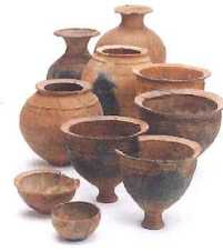
▲田原迫ノ上遺跡(鹿屋市)出土の土器

期 間 12.7 [金] ▶ H31.3.21 [木・祝] 場 所 上野原縄文の森 展示館企画展示室 入 場 料 展示館利用料金