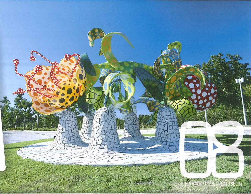
KIRISHIMA OPEN-AIR MUSEUM